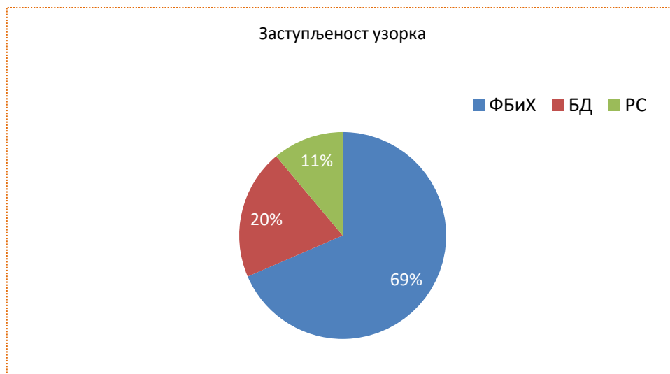
Слика 2: Процентуална заступљеност реализованог узорка у БиХ

Из Табеле 3. може се видјети да у реализацији постоје одређена одступања од планираног узорка. Предшколске установе из три кантона у ФБиХ нису одговориле на позив за учешће у истраживању (N=0). Међутим, проценат реализованог узорка може се сматрати репрезентативним за подручје ФБиХ (N=74).