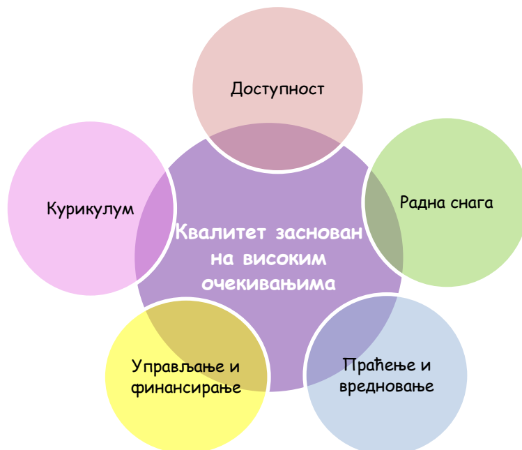
Слика 1. Оквир за квалитет раног и предшколског васпитања и образовања

Европски Оквир за квалитет у раном и предшколском васпитању и образовању заснива се на следећим принципима: